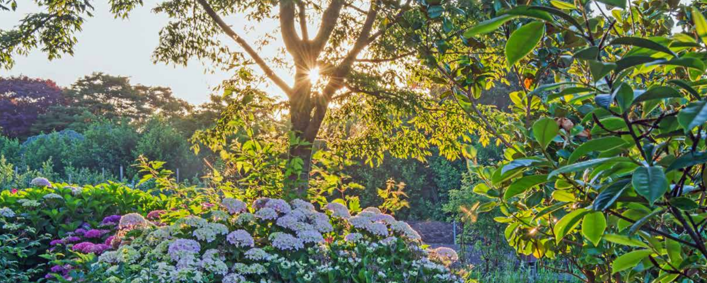
◀ De ochtendzon stuurt haar eerste stralen over de kwekerij. Vooraan Hydrangea macrophylla 'Frau Mariko'.