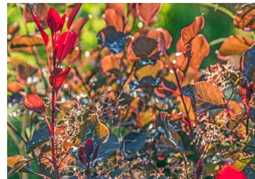
▲ Cotinus 'Dusky Maiden'