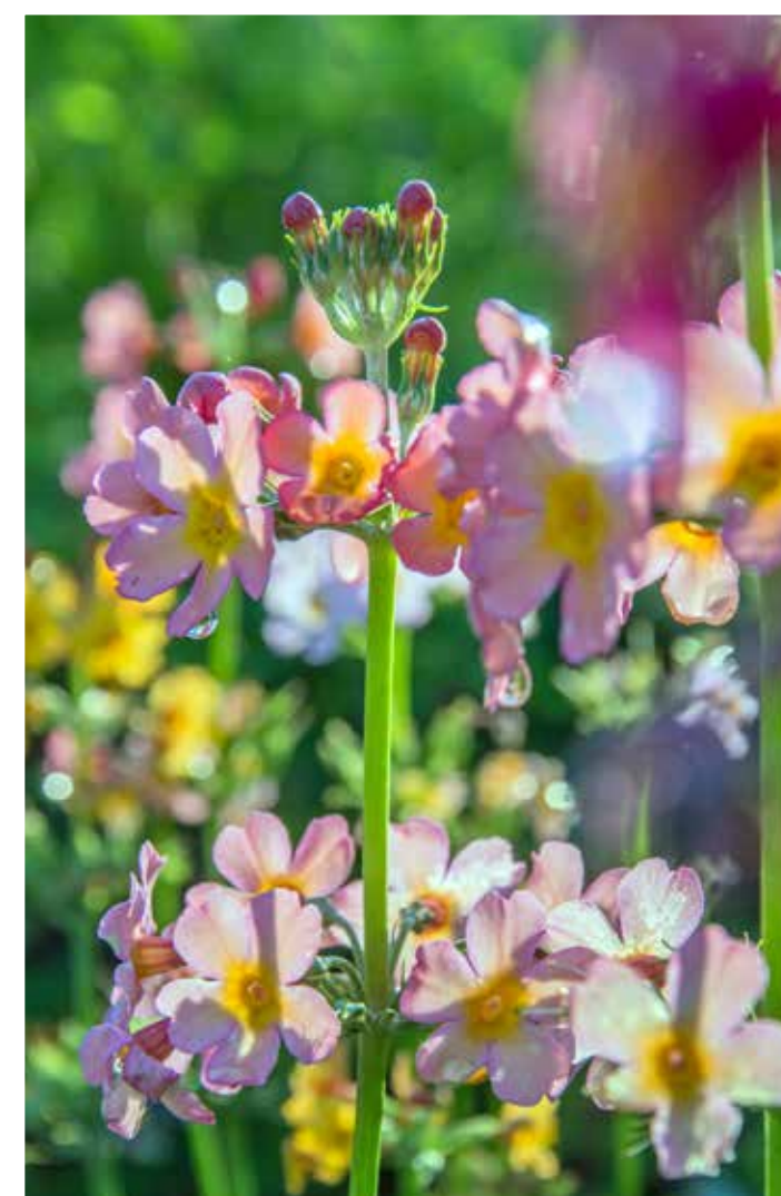
▲ Primula bulleesiana ◀ Kwekerij PlantenTuin Esveld heeft een parkachtige allure.