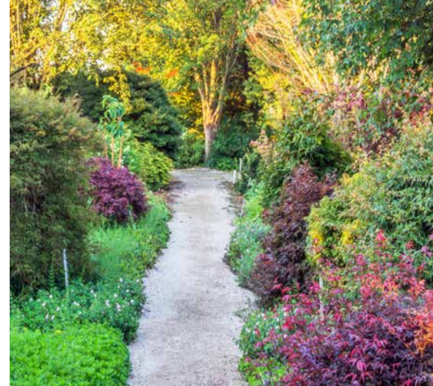
Op een natuurlijke manier worden de bomen, struiken en vaste planten gepresenteerd. ►