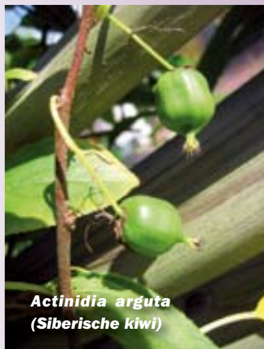
Actinidia arguta (Siberische kiwi)

De Mur Végétal van Patrick Blanc was het startpunt van de opmars van de verticale tuin. Hij gebruikte listige bouwkundige constructies om gevels te begroenen met planten die van nature de bodem bedekken. De opmerkelijke resultaten met 'kantelen' van beplanting veroorzaakten groot enthousiasme bij beleidsmakers en architecten. Maar waar is de klimplant in dit verhaal? Misschien zien wij het bij Esveld wel te simpel. Met een klein ruggensteuntje biedt de klimplantenwereld talloze mogelijkheden. Neem bijvoorbeeld de wilde wijnrank die in de herfst heerlijk staat te vlammen. Of de geweldige groei van de blauwe regen, die ook nog eens prachtig kan bloeien, mits je een geënt exemplaar neerzet. Je kan zelfs een eetbare gevel maken, met druivenranken, Japanse wijnbessen en Siberische kiwi.