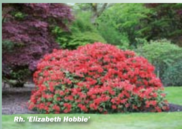
Rh. 'Elizabeth Hobbie'

Begin de lente met een Dagje Boskoop! Verschillende kwekerijen in Boskoop nodigen u uit om op deze dagen een kijkje komen te nemen in de schatkamer van de sierteelt. Ook het Boskoopse museum met zijn charmante museale kwekerij en de vernieuwde sortimentstuin 'Harry van de Laar' (een eindje verderop aan onze straat, op nr.153) zijn een bezoekje waard. Een rondvaart tussen de kwekerijen met gids is deze twee dagen ook mogelijk zonder afspraak. Zie ook www.dagjeboskoop.nl