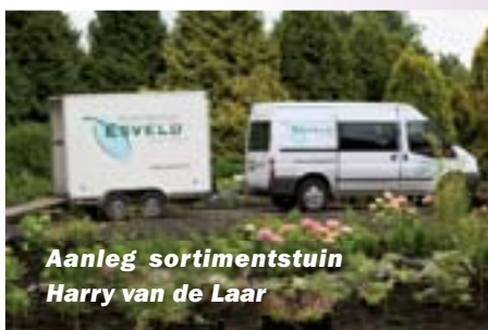
Aanleg sortimentstuin Harry van de Laar

Meer inspiratie is te vinden in de sortimentstuin 'Harry van de Laar' in Boskoop, die recent volledig opnieuw is ingericht. Diverse kwekerijen kregen binnen een ontwerp van Yolanda Boekhoudt de ruimte om een eigen plantenoval in te vullen. Esveld maakte een ontwerp van hortensia en siergrassen op een voet van geranium. Deze interessante nieuwe tuin ligt op minder dan een kilometer van onze kwekerij, aan dezelfde straat. Gratis toegankelijk. Ideaal om te combineren met een bezoek aan onze PlantenTuin.