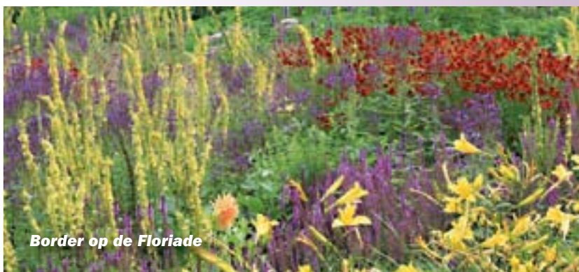
Border op de Floriade

Ontwerpen met planten: het lijkt een voor de hand liggend uitgangspunt. Maar toch zien we vaak ontwerpen waarin de beplanting slechts functioneert als noodzakelijke stoffering. En dan vaak ook nog slecht bedacht (vinden wij...). Als dieptepuntje zagen we een rhododendron-border, op de klei en vlak aan zee, afgezoomd met lavendel. Kansloos, toch? Wij zijn er van overtuigd dat een beplanting alleen maar kans van slagen heeft als de planten zich prettig voelen, net als wijzelf. Dat maakt dat de wensen van de plant voor de standplaats richtinggevend zijn voor de toepassing. Nu kunnen we voor elke standplaats en iedere esthetische wens wel een geschikte tuinplant vinden met de ruim tienduizend verschillende tuinplanten die tot onze beschikking staan. Maar we doen meer dan alleen adviseren over beplanting. We ontwerpen ook hele tuinen of zelfs parkdelen. Het afgelopen jaar mochten wij bijdragen aan de heesterbeplanting op de Floriade.