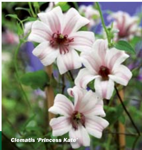
Clematis 'Princess Kate'

Esveld is al jaren beheerder van de Nederlandse Plantencollectie Hydrangea en mede daarom durven wij ons de Nederlandse specialist te noemen in deze prachtige planten. Ruim 600 verschillende soorten en cultivars staan tijdens het weekend stralend te bloeien in de collectietuin. Natuurlijk niet allemaal, want de spreiding in bloeitijd en hoogte biedt uitgekende mogelijkheden voor het gebruik in uw tuin. En dat geldt ook voor Clematissen. Slim kiezen betekent daarbij van april tot oktober altijd een bloeiende soort. Op deze dagen presenteren wij ook altijd nieuwe soorten. In Boskoop is nu ook de vakbeurs Plantarium , die op zaterdag ook geopend is voor het publiek.