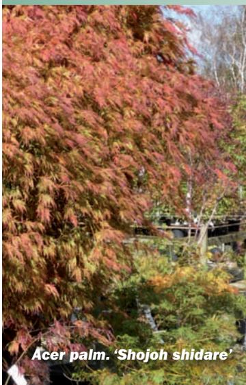
Acer palm. 'Shojoh shidare'

De familie van Japanse esdoorns, Acer, staat centraal in onze traditionele presentatie. U kunt zich vergapen aan de onvoorstelbare variatie in kleur, bladvorm en groeihoogte van tientallen soorten. Impressies van 'Japan' zijn niet compleet zonder de talloze azalea's, die nu op de kwekerij in bloei staan. De Nederlandse Bonsaivereniging demonstreert hoe u een bonsai-boompje maakt van die gekke zaailing of dat fout gegroeide heestertje van u of van ons.