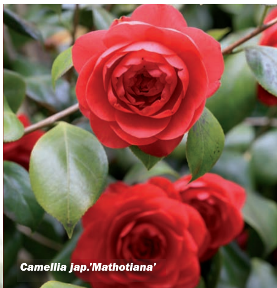
Camellia jap. 'Mathotiana'

Een tuin is meer dan een verzameling planten. De schoonheid van het totaalbeeld, in elk seizoen, ontstaat door de meerwaarde van mooie combinaties. Dat is niet altijd simpel, meestal zelfs behoorlijk ingewikkeld. Je moet weten hoe planten groeien, hoe ze zich ontwikkelen, hoe ze zich gedragen ten opzichte van de burens en hoe veeleisend ze zijn. Net mensen, eigenlijk. Alleen kunnen ze helaas niks zeggen, dus de tuinier moet het zelf maar ontdekken. Vergissingen kunnen veel tijd en veel geld kosten. Esveld specialiseerde zich daarom ook in tuinontwerp en beplantingsadvies. En wij halen onze neus niet op voor een kleine tuin of een kleine opdracht. Voorbeelden van onze succesvolle grote projecten in het afgelopen jaar vindt u op pagina 4 van deze krant.